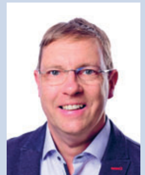
Ihr Michael Hultsch Bürgermeister

Ich wünsche Ihnen noch einmal ein gesundes und erfolgreiches neues Jahr und bleiben Sie gesund!