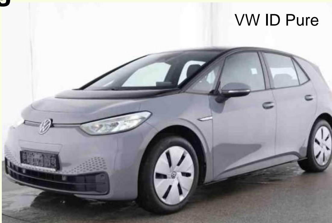
VW ID Pure