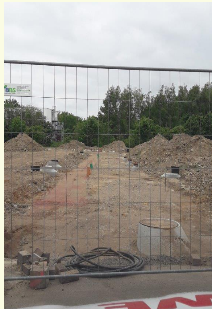
- Erschließung „Am Schwanenteich“