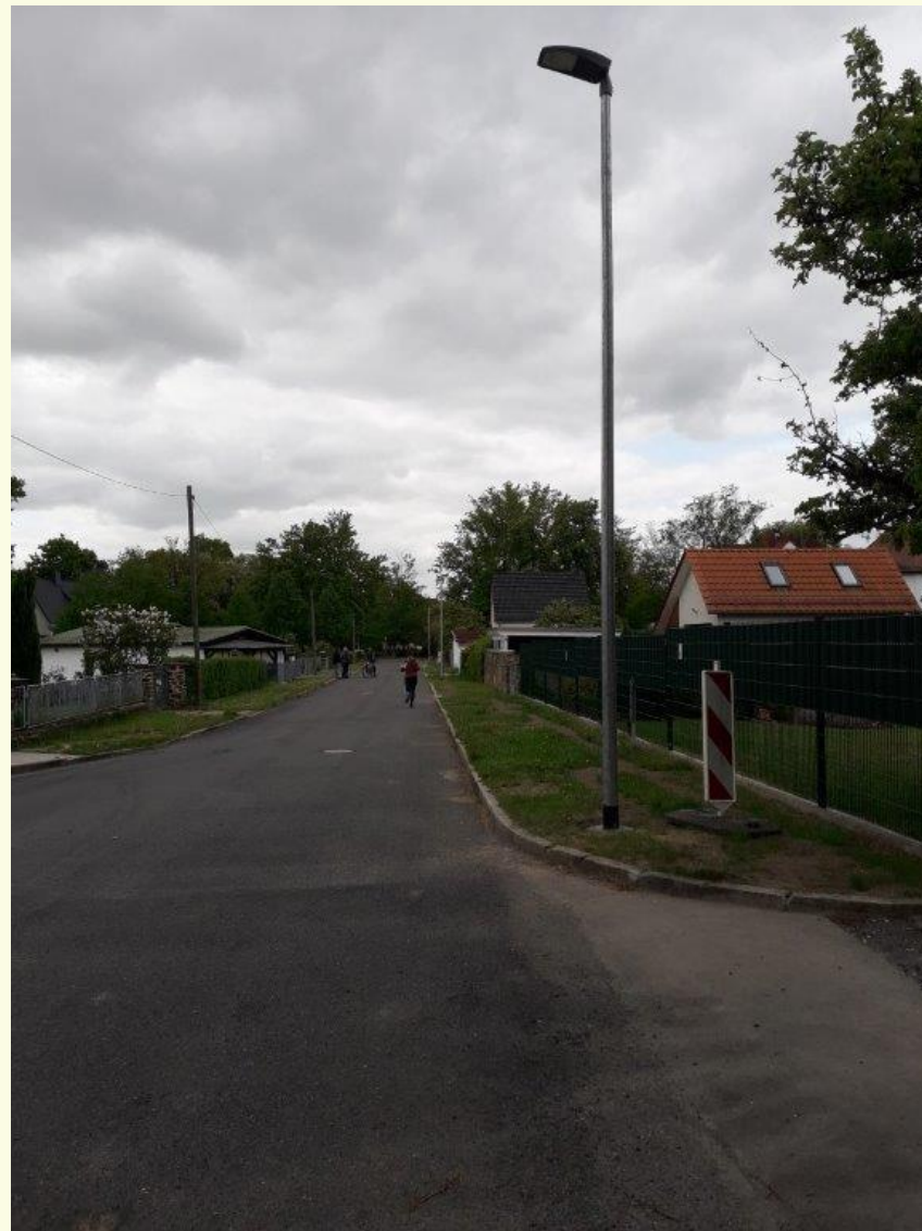
- Straßenbeleuchtung Lindenstraße