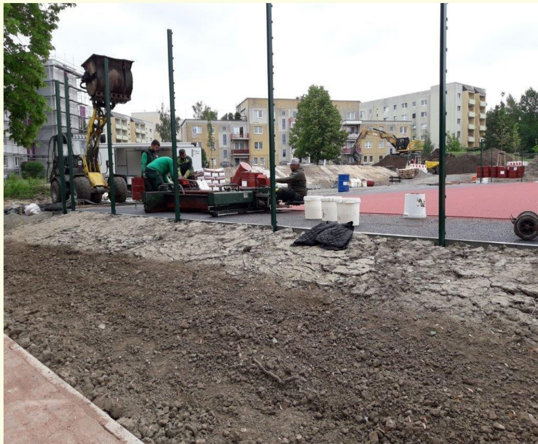
- Sport-und Freizeitfläche