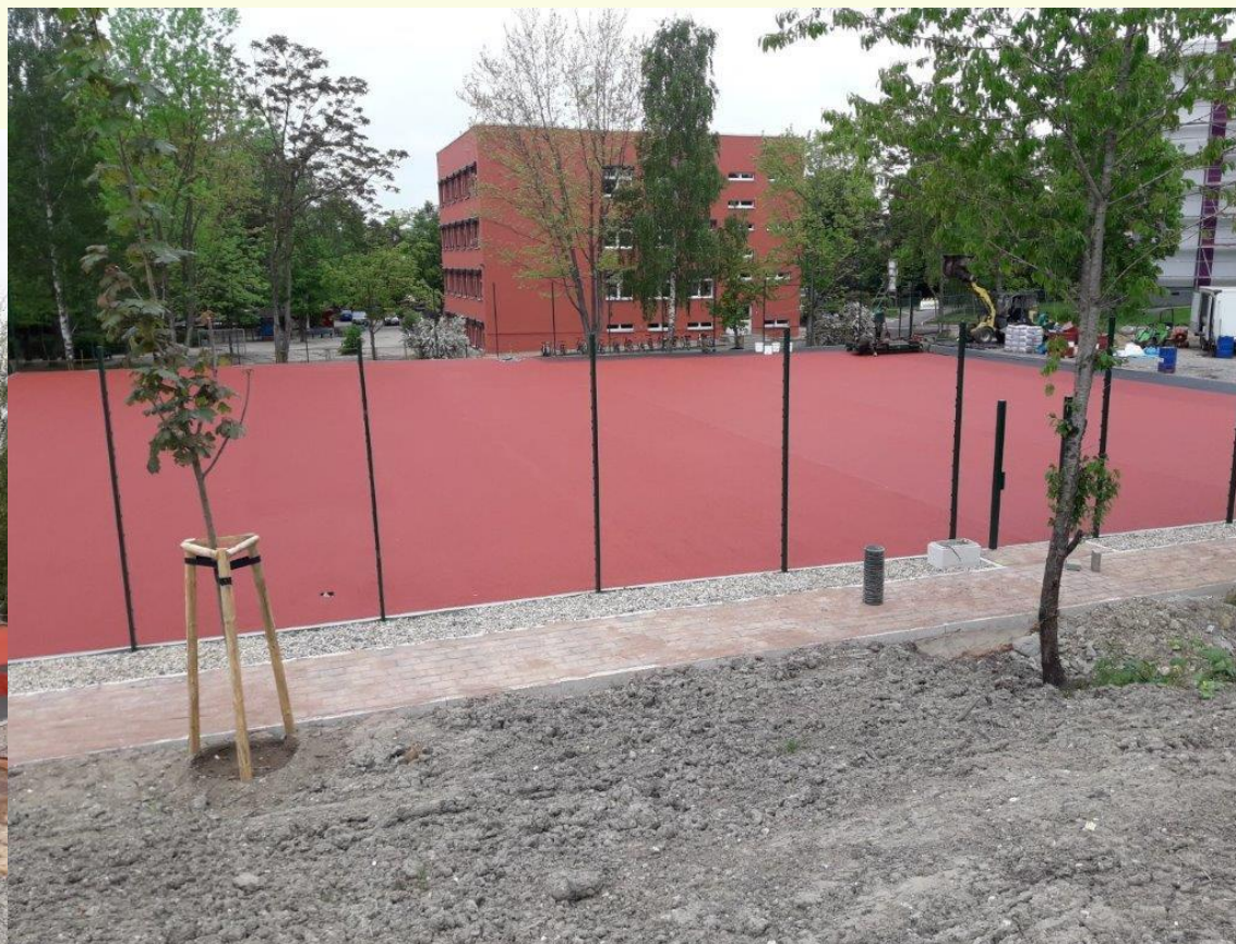
- Sport-und Freizeitfläche