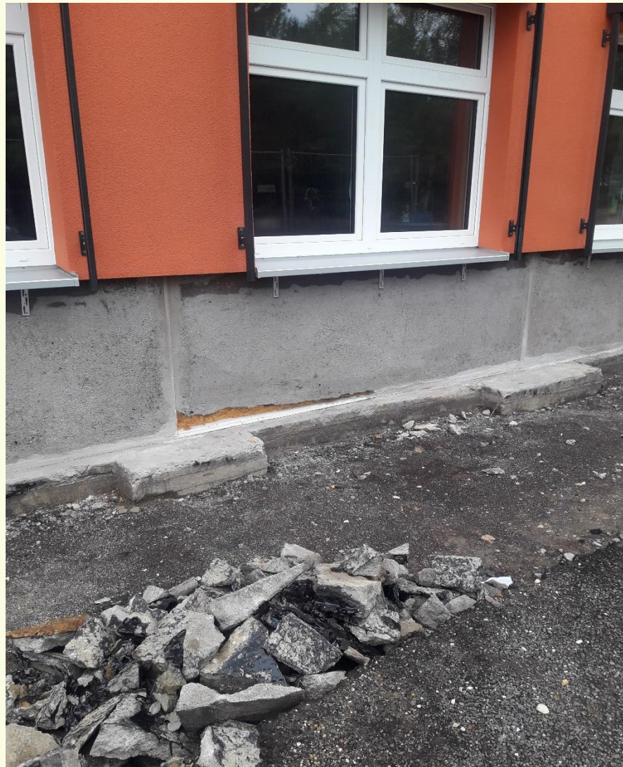
Wetterschalen im Sockelbereich