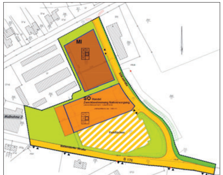
Anlage Übersichtsplan: Geltungsbereich Bebauungsplan Nr. 64/2 „Sondergebiet Ballendorfer Straße“ 2. Änderung