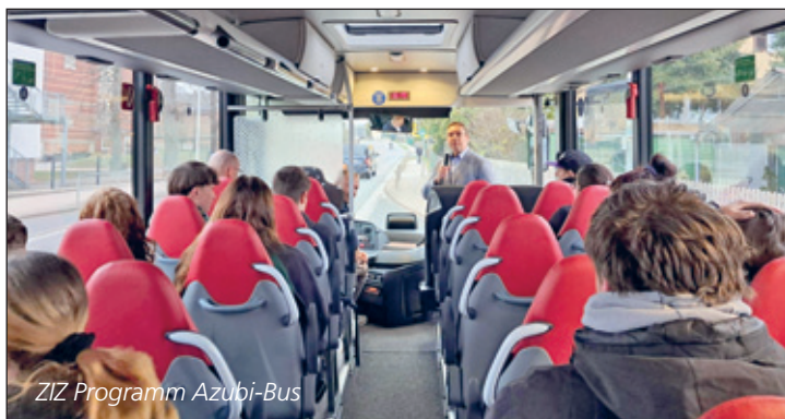
ZIZ Programm Azubi-Bus

Die erfolgreiche Umsetzung des Projekts wurde durch die Unterstützung der Bad Lausicker Unternehmen, des Zentrenmanagements sowie der Schulen ermöglicht und vom Bundesprogramm Zukunftsfähige Innenstädte und Zentren (ZIZ). Ein besonderer Dank gilt dem Busfahrer und dem DRK Geithain für die Bereitstellung des Busses sowie allen Unternehmen, die ihre Türen für den Nachwuchs geöffnet haben. Zu den teilnehmenden Betrieben gehörten unter anderem das Pflegeheim Paul Gerhardt, Reuter & Schreck GmbH, das Betonwerk Bad Lausick, die Sparkasse Muldentale, Elektro Leh-