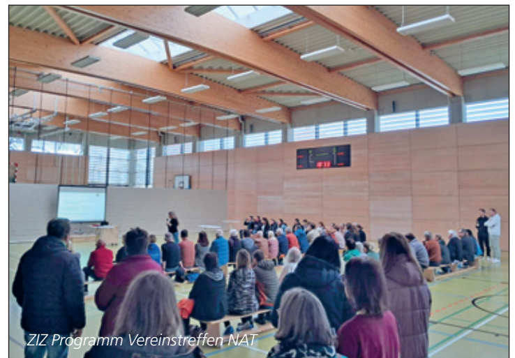
ZIZ Programm Vereinstreffen NAT

Bitte melden Sie sich gern unter zentrenmanagement@bad-lausick.de